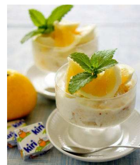
日向夏のティラミス