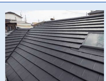
ガルバリウム鋼板