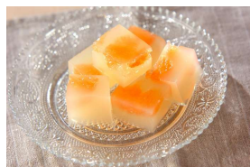
グレープフルーツ 寒天