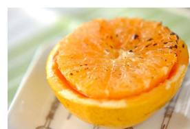
グレープフルーツの バターオーブン焼き