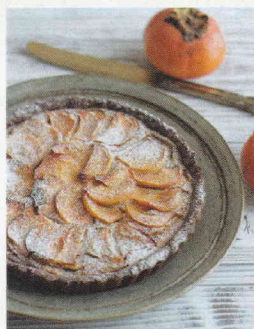
柿とチョコレートのタルト